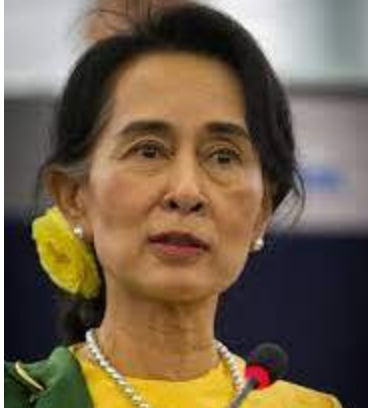
AUNG SAN SUU KYI

Mjanmarská aktivistka, získala Nobelovu cenu za mier (1991) za svoju neúnavnú prácu na obranu demokracie a ľudských práv.